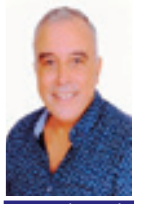
Par Mohamed Benarbia

Casa mon amour ! Eh oui ! Ma grande chérie, ma bien-aimée dans sa plus belle parure !