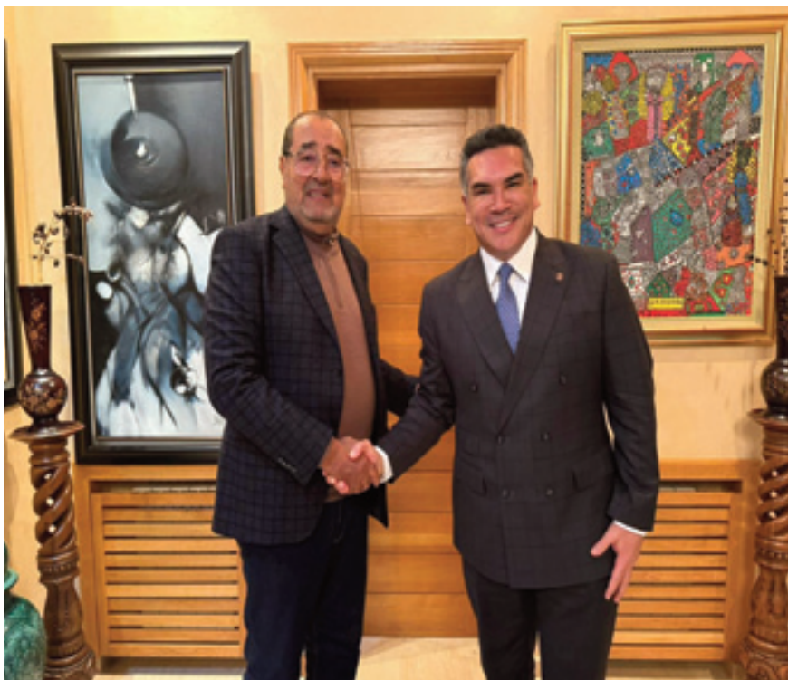
Le Premier secrétaire de l'USFP, Driss Lachguar en compagnie de Alejandro Moreno, président du PRI, lors du Congrès international de l'IS à Rabat.