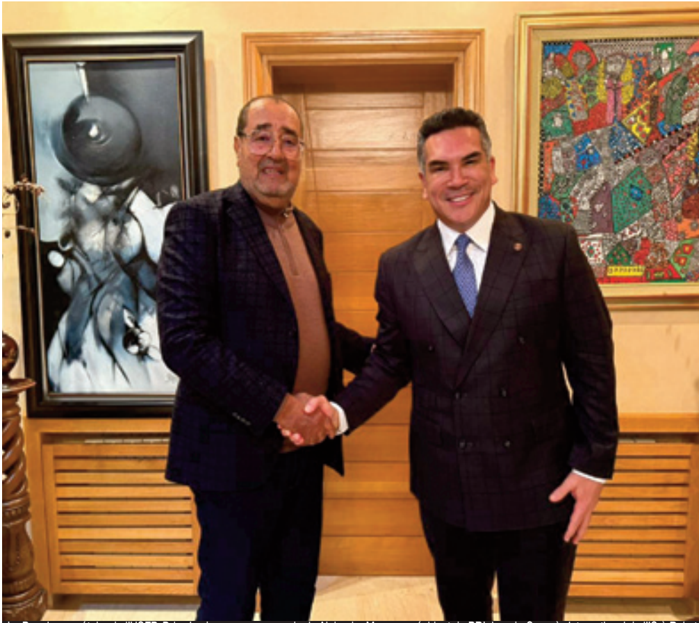
Le Premier secrétaire de l'USFP, Driss Lachguar en compagnie de Alejandro Moreno, président du PRI, lors du Congrès international de l'IS à Rabat.

Le Premier secrétaire de l'USFP, Driss Lachguar, entame aujourd'hui une visite au Mexique sur invitation du Parti révolutionnaire institutionnel (PRI) pour participer aux célébrations du 96 e anniversaire de la création de cette formation politique historique.