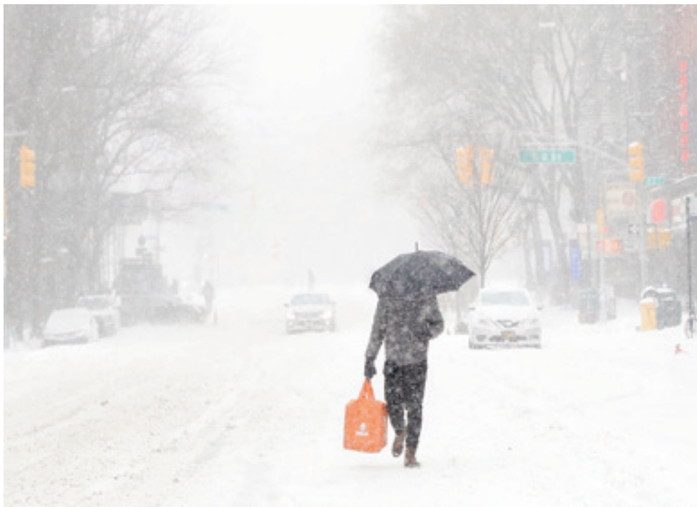
Kansas City, Quinton Lucas.

Les vols ont ensuite repris après le dégagement des pistes, a précisé le maire de