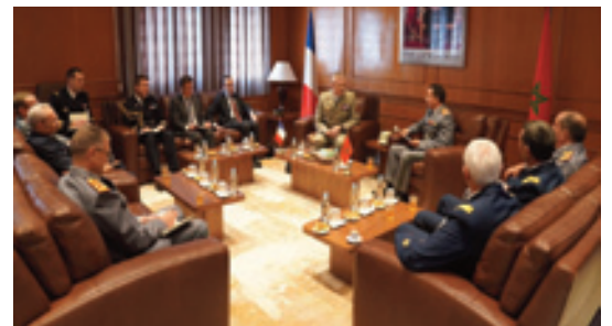
Tenue à Rabat de la 22 ème réunion de la Commission militaire mixte maroco-française