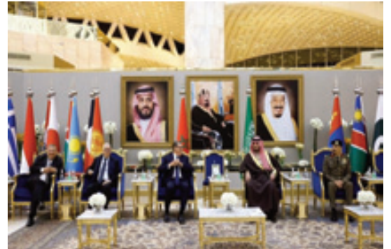
Le chef du gouvernement représente SM le Roi au Sommet "One Water"

Les retraités obtiennent gain de cause tout en aspirant à une réforme globale