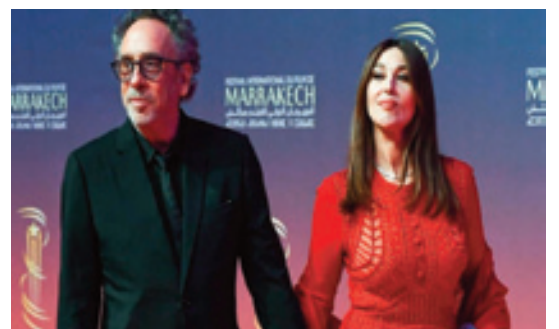
"Maria Callas : Lettres et mémoires" illumine le FIFM grâce à Monica Bellucci