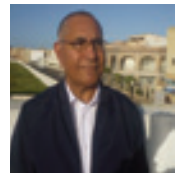
Par Mustapha Jmahri Auteur-éditeur des cahiers d'El Jadida

Après six ans d'études, de stages, et d'échanges, cette jeune architecte est fière aujourd'hui du résultat obtenu et espère trouver de l'écoute au niveau de sa ville natale qu'elle aime et pour laquelle elle a consacré son travail.