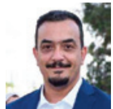
Par Ali Rhanbouri

L'engagement du Maroc dans la transition énergétique et la sécurisation des ressources hydriques démontre une vision stratégique consciente des risques actuels et des besoins futurs, et avec des efforts nationaux et internationaux concertés, permettra au Maroc de consolider sa position en tant qu'acteur régional et international clé dans le domaine de la durabilité, et de soutenir ainsi ses ambitions de développement tout en assurant le bien-être des générations futures.