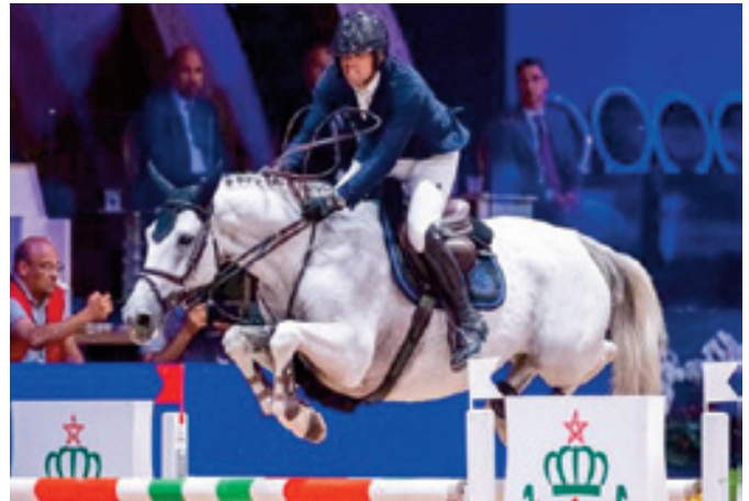
Son Altesse Royale le Prince Héritier Moulay El Hassan avait présidé, samedi, la finale de la 7ème édition du Grand Prix de Sa Majesté le Roi Mohammed VI de Tbourida, organisée dans le cadre de la 15ème édition du Salon du cheval d'El Jadida.

Il a soutenu que le Salon, devenu une plateforme de rencontre et d'échange d'expériences, a également été marqué par l'organisation de plusieurs rencontres institutionnelles et professionnelles, qui ont abouti à la signature de nombreux accords de partenariat et de coopération entre divers acteurs, tant au Maroc qu'à l'international, ajoutant que la 15ème édition s'est aussi distinguée par le haut niveau des compétitions et des espaces d'exposition.