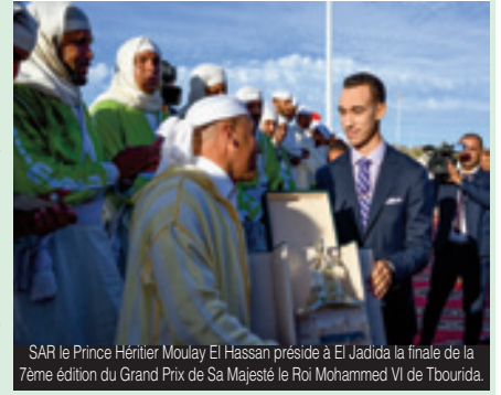
SAR le Prince Héritier Moulay El Hassan présidant à la finale de la 7 ème édition du Grand Prix de Sa Majesté le Roi Mohammed VI de Tbourida.

Les cavaliers sont également notés sur le degré de coordination et de communication, la maîtrise de leur monture, ainsi que sur l'allure générale du cavalier et de son cheval.