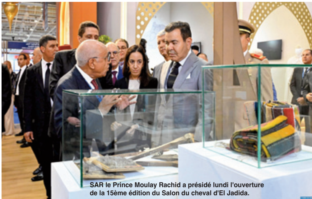
SAR le Prince Moulay Rachid a présidé lundi l'ouverture de la 15ème édition du Salon du cheval d'El Jadida.

Évènement d'envergure devenu incontournable pour les amateurs du cheval et les acteurs de l'écosystème équin, le Salon d'El Jadida, dont la 15ème édition se tient du 1er au 6 octobre courant, s'est érigé surtout en plateforme clé pour la promotion de la filière et du riche patrimoine culturel immatériel lié au cheval.