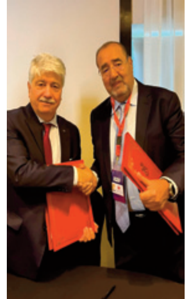
et de Ahmed Majdalani.

Parallèlement à la participation fructueuse et agissante du parti de l'Union socialiste des forces populaires aux travaux du Forum social-démocrate arabe tenus au Caire en préparation des assises du Congrès de l'Alliance progressiste prévues les 5 et 6 octobre au Chili, une participation menée par le Premier secrétaire, Driss Lachguar, ce dernier, accompagné de la délégation composée de membres des instances dirigeantes du parti, a tenu des séances de travail et de concertation avec nombre de partis politiques affiliés à ladite alliance et partageant les mêmes préoccupations, objectifs et référentiel, au cours desquelles il fut procédé à la signature de conventions de partenariat et de coopération dont la teneur était dûment et mûrement réfléchie bien avant l'évènement en cours.