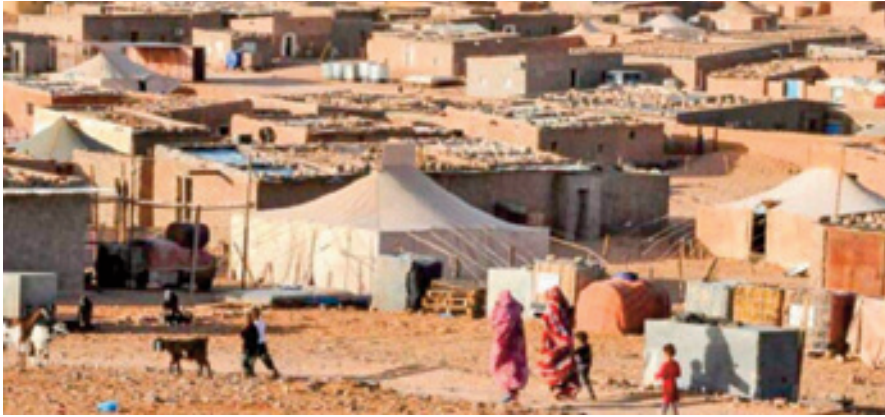
Les camps de la honte à Tindouf

Dans un communiqué rendu public le 12 août courant, le Mouvement sahraoui pour la paix (MSP), né le 22 avril 2020 d'une scission au sein du mouvement séparatiste «polisarario», appelle depuis Madrid à «un débat sincère et responsable entre tous les courants politiques sahraouis, y compris le «polisarario» et les notables tribaux, afin de trouver une issue pacifique à la tragédie que subissent les Sahraouis depuis cinquante ans», et ce «sur la base de la Conférence de Dakar», qu'il a coorganisée, fin octobre 2023, dans la capitale sénégalaise, avec le Centre africain d'intelligence stratégique pour la paix (CISPaix).