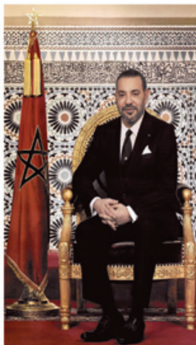
A l'occasion du 25 ème anniversaire de l'accession au trône de SA MAJESTE LE ROI MOHAMMED VI