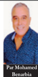
Par Mohamed Benarbia

Se vouloir «leader» de quelque tendance ou mouvement Sou, a fortiori, d'un parti politique que ce soit suppose que l'on doit disposer des compétences et mérites requis. La sagesse en fait partie bien évidemment, ce qui signifierait dans un langage plus accessible avoir de la jugeote.