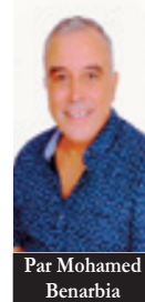
Par Mohamed Benarbia

On a bien l'impression d'avoir affaire à un gouvernement qui fait du blocage une priorité. A peine parvient-on à débloquer ce qu'un ministre s'était appliqué à bloquer qu'un autre fait des siennes cherchant obstinément à démontrer qu'il est plus bloqueur que son collègue bloqueur. Et pendant ce temps, c'est tout un pays qui boit la tasse.