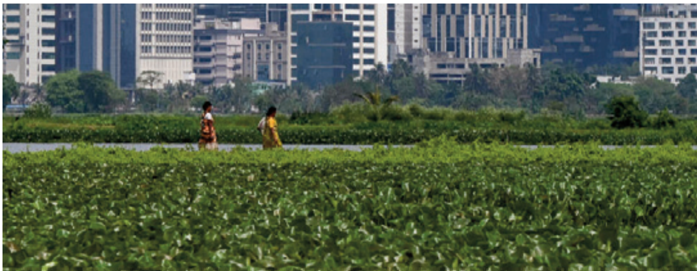
"Les reins de Calcutta"