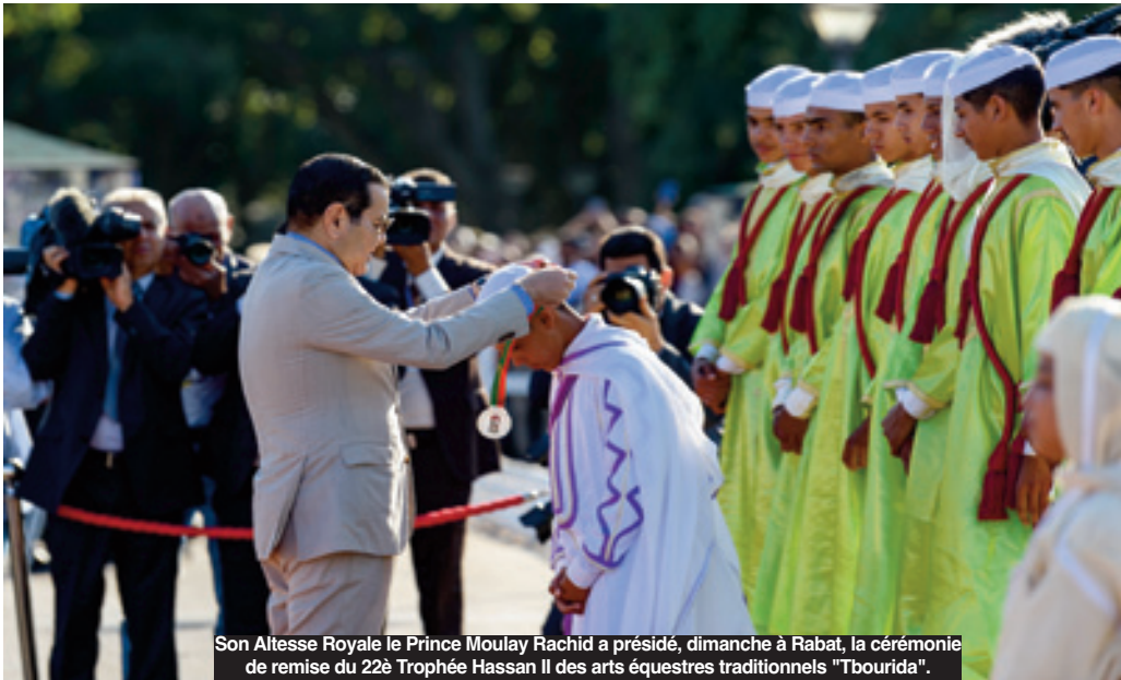
Son Altesse Royale le Prince Moulay Rachid a présidé, dimanche à Rabat, la cérémonie de remise du 22 e Trophée Hassan II des arts équestres traditionnels "Tbourida".

La Sorba du Moqaddem Harit El Yousfi (région de Casablanca-Settat) a remporté, dimanche à Dar Es Salam à Rabat, la 22 e édition du Trophée Hassan II des arts équestres traditionnels "Tbourida", comptant pour le championnat du Maroc seniors 2023 (05-11 juin).