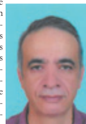
Par Abdellatif Jaid

Le potentiel des Adouls quoi que méconnu a permis à la profession de concevoir un modèle novateur de gestion des dépôts en consignation et d'initier d'autres chantiers de modernisation afin de continuer à évoluer dans l'environnement de la digitalisation et de la dématérialisation des processus conduits par les pouvoirs publics, en symbiose avec le Nouveau modèle de développement.