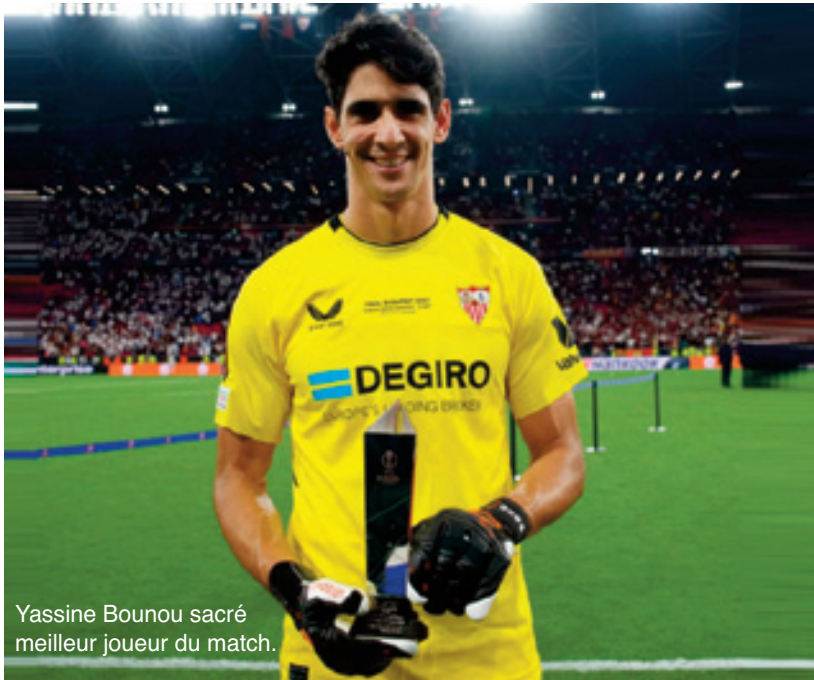
Yassine Bounou sacré meilleur joueur du match.

La presse sportive espagnole a encensé, jeudi, la prestation "exceptionnelle" du portier marocain du FC Séville, Yassine Bounou, après la victoire de son équipe contre l'AS Rome, lors de la finale de l'Europa League, disputée