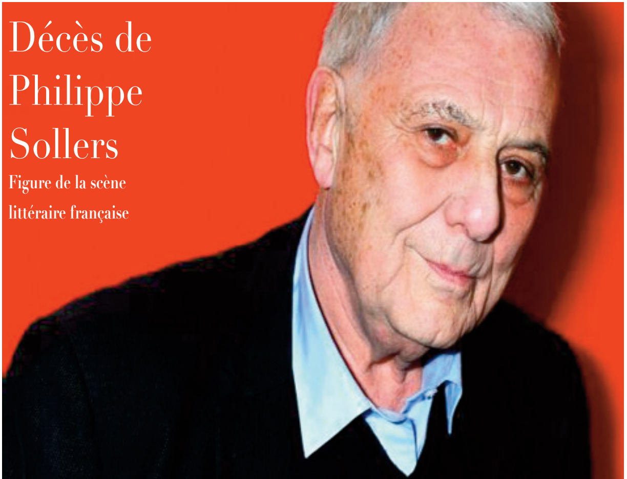
Figure de la scène littéraire française

Auteur de plus de 80 romans, essais et monographies, directeur de revues, Philippe Sollers, décédé à l'âge de 86 ans, était une figure de la scène littéraire française et du Tout-Paris depuis plus d'un demi-siècle.