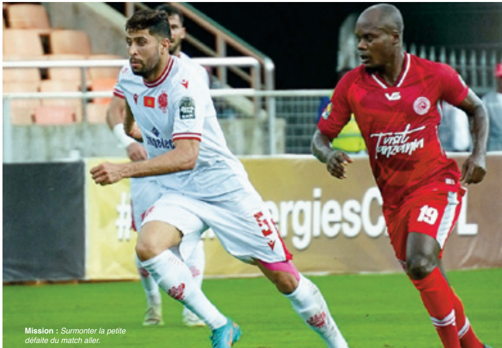
Mission : Surmonter la petite défaite du match aller.

C'est le cas du match de samedi qui opposera, toujours au Complexe Mohammed V, le Raja de Casablanca au National du Caire. Les Verts ont été défaits à l'aller par 2 à 0, résultat qui ne compromet pas outre mesure leurs chances de qualification, d'autant plus que pour