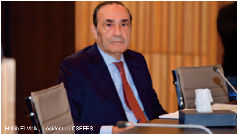
Habib El Malki, président du CSEFRS.

Le Conseil supérieur de l'éducation, de la formation et de la recherche scientifique (CSEFRS) a tenu, mercredi, une réunion consacrée à la présentation des résultats d'un rapport élaboré par l'Instance nationale d'évaluation sur la question de la violence en milieu scolaire.