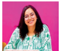
Par Wiam Hamed

Par prise de conscience de la Jeunesse Itihadie que le développement peut avoir lieu sans pour autant utiliser, d'une manière irrationnelle, les richesses et les ressources naturelles, elle a élaboré un projet qui sera présenté au 9ème congrès de la J-USFP, qui aura lieu les 27-28-29 septembre 2022 avec pour slogan « Dignité, liberté et égalité », affirmant qu'« il n'y a pas d'autre alternative que de recadrer la relation qui relie l'être humain à l'environnement, et en faire une relation fondée sur l'idée de protection et de préservation de l'environnement, richesses et ressources naturelles, en rationalisant leur gestion en fonction des besoins humains nécessaires ».