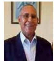
Par Mustapha Jmahri

Seul problème pour lequel il faut rester vigilant, c'est la sauvegarde de cet environnement végétal vulnérable par la sensibilisation des visiteurs et des riverains afin de veiller à la propreté des lieux et au respect des plantes. Dans cette perspective, la présence d'un garde forestier est indispensable.