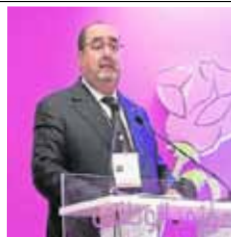
Driss Lachgar, líder de la Unión Socialista de Fuerzas Populares