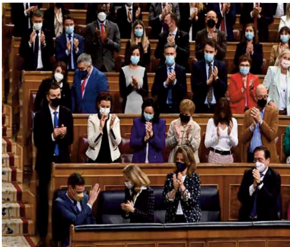
Pedro Sanchez acclamé lors d'une séance du Congreso de diputados.