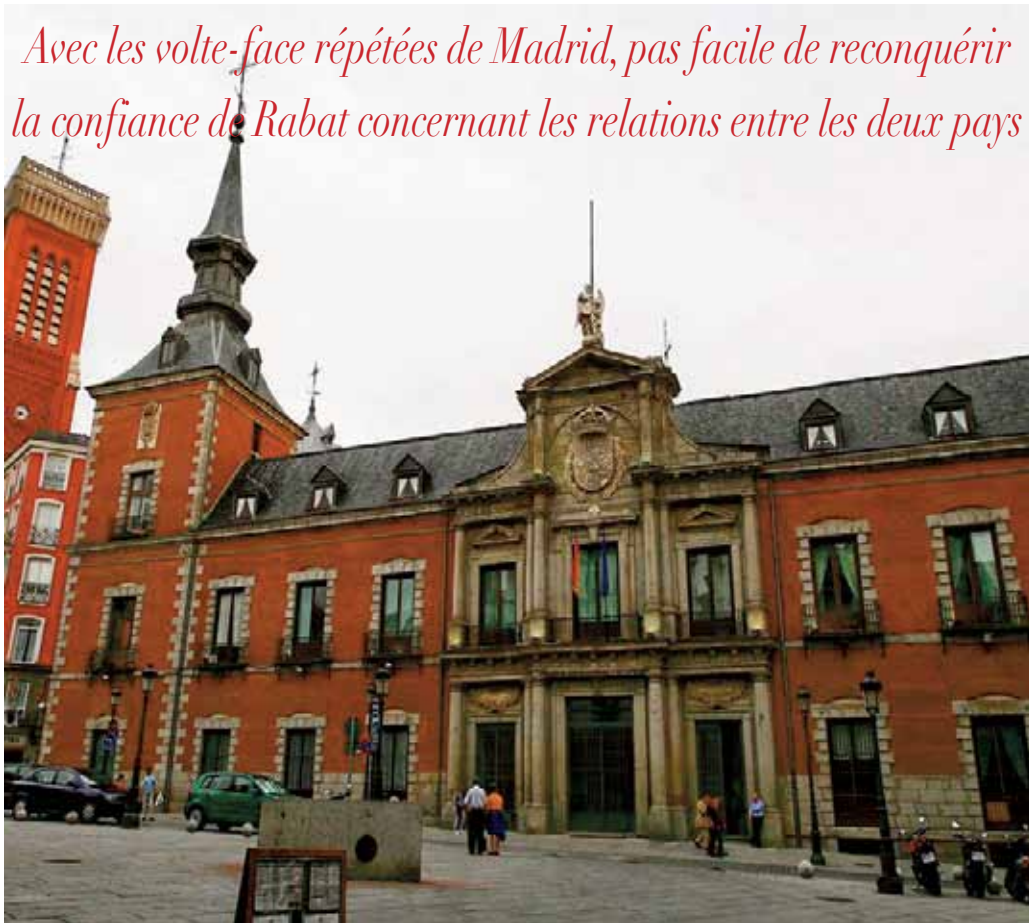
Siège du ministère des Affaires étrangères espagnol.

Avec les volte-face répétées de Madrid, pas facile de reconquérir la confiance de Rabat concernant les relations entre les deux pays