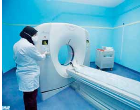
la santé et de la protection sociale.

En chiffres, la province de Youssoufia compte 17 établissements de soins de santé primaires (4 Maisons d'accouchement) et un Centre Hospitalier Provincial d'une capacité de 45 lits, selon les données de la délégation provinciale de