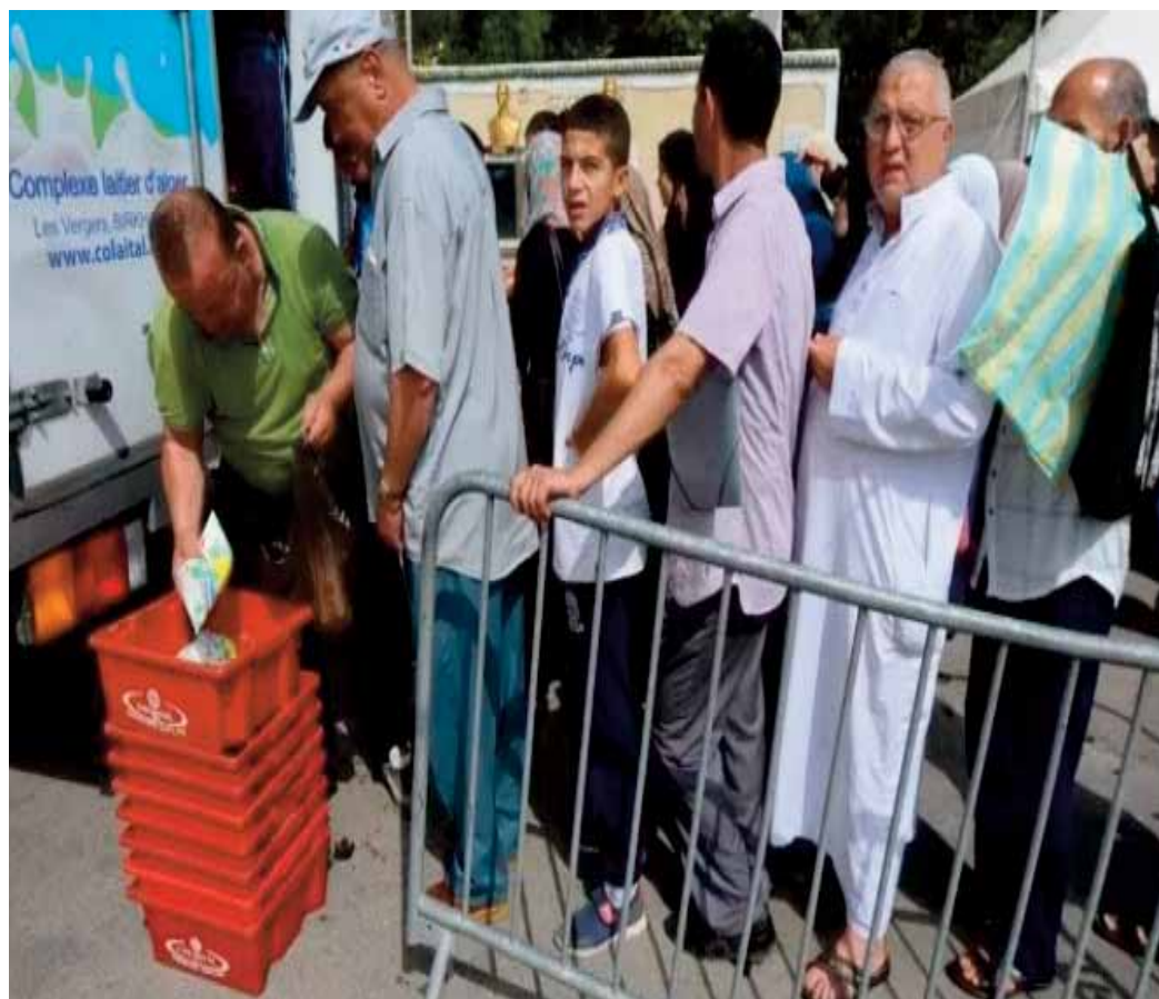
Lire page 3

Un coup monté, s'insurgent des dirigeants butés montrant du doigt la Banque mondiale et... le Maroc !