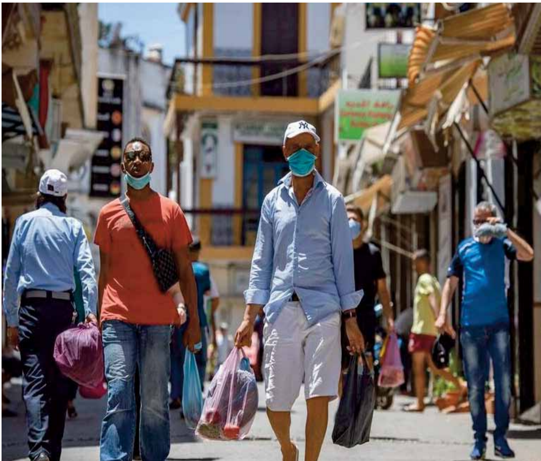
Lire page 3

Être préparé pour faire face aux épidémies, c'est tout un chantier qu'il va falloir creuser encore et encore