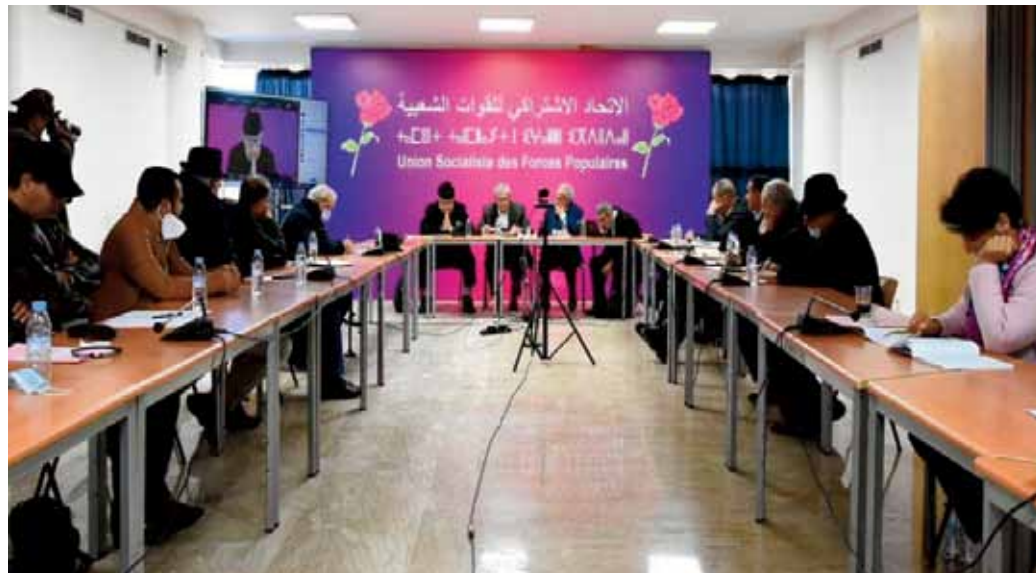
Lire pages 2-3

Coupe arabe des nations Le Maroc surclasse la Jordanie et s'offre les quarts