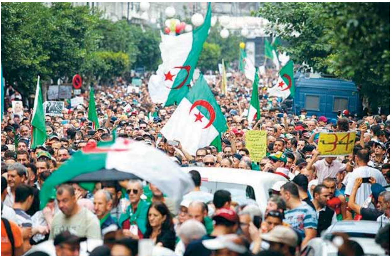
Le peuple algérien est là pour manifester son rai-le-bol.