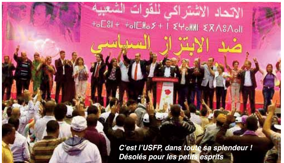
C'est l'USFP, dans toute sa splendeur ! Désolés pour les petits esprits

- Son alliance avec le parti qui était à la tête du gouvernement et qui en a été écarté à la faveur de la démarche démocratique.