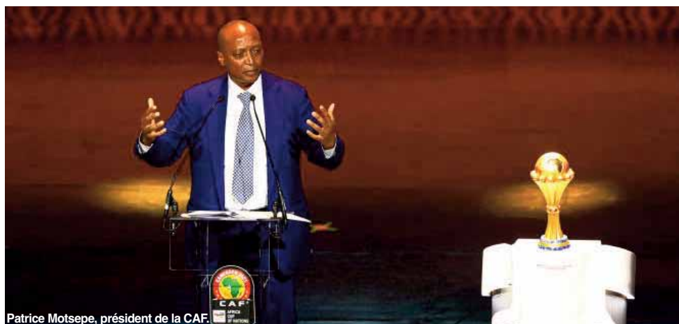
Patrice Motsepe, président de la CAF.

La Confédération africaine de football (CAF) est depuis vendredi la première instance continentale à approuver officiellement l'idée controversée d'une Coupe du monde tous les deux ans, sur le même rythme que sa Coupe d'Afrique des nations (CAN).