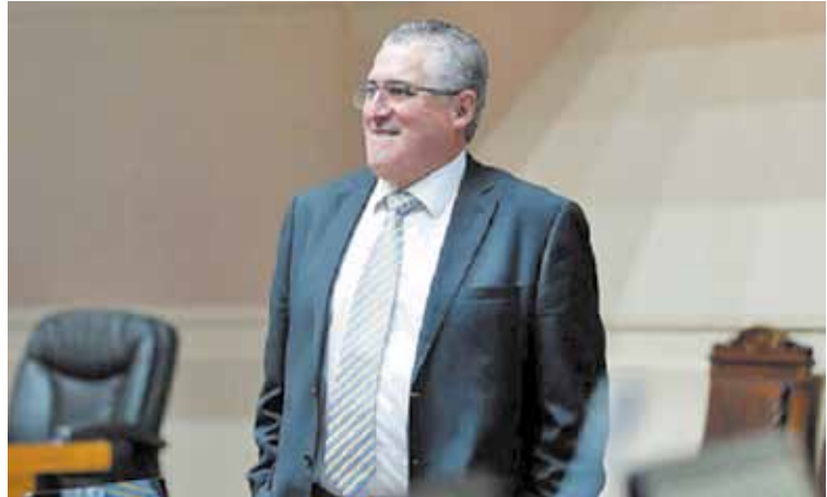
S.M le Roi Mohammed VI.