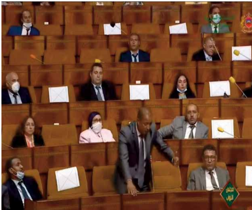
Lire page 3

Le Groupe socialiste regrette une décision hâtive, prise sans fournir d'explication, semant ainsi la confusion parmi les citoyens