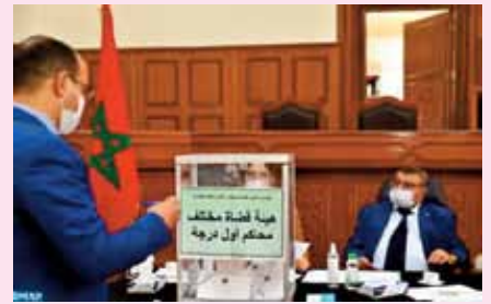
L'opération de vote a démarré à 09H00 dans 24 bureaux de vote répartis sur les différentes Cours d'appel du pays, dans le respect des mesures de précaution sanitaires imposées par l'épidémie de Covid-19.

Le taux de participation des magistrats a été de 87% pour les Cours d'appel et 92,45% pour les tribunaux de premier degré, a-t-on ajouté de même source.