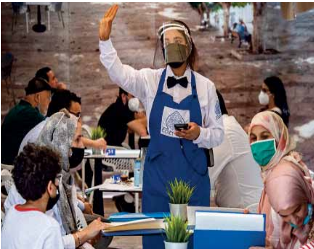
Lire page 4