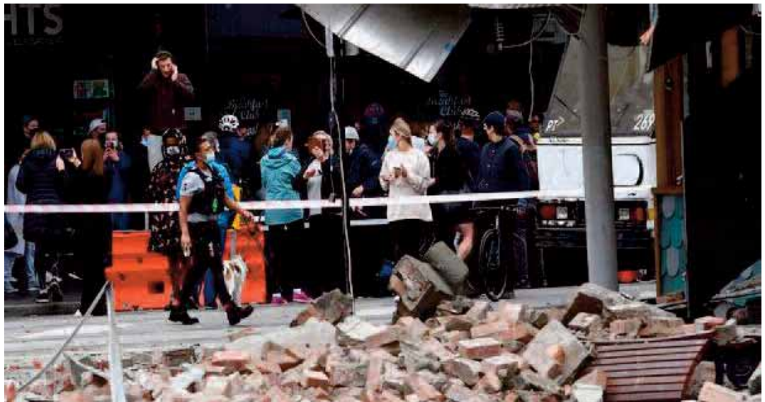
l'Université de Melbourne.