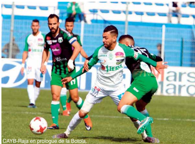
CAYB-Raja en prologue de la Botola.

Sauf qu'entre vouloir et pouvoir, il y a un sacré monde. D'autant plus qu'en héritant d'entrée d'un Raja qui a renforcé ses rangs, renfloué sa trésorerie et préservé son staff technique, le CAYB ne pourra bénéficier outre mesure de l'avantage de se produire à la mai-