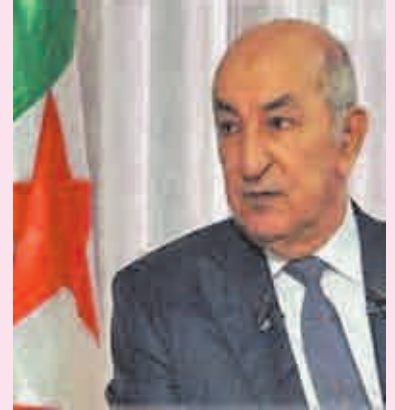
de sa sainte miséricorde et de préserver le peuple algérien frère de tout malheur, tout en souhaitant prompt rétablissement aux blessés.

Sa Majesté le Roi dit partager avec le Président algérien et avec les familles éplorées Ses sentiments de tristesse suite à cette perte cruelle, implorant le Tout-Puissant de leur accorder réconfort et compassion, d'entourer les victimes