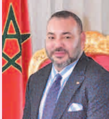
Sa Majesté le Roi Mohammed VI a adressé un message de condoléances et de compassion au Président de la Répu-

blique algérienne démocratique populaire, son Excellence M. Abdelmajid Tebboune, suite aux incendies de forêts qui ont fait plusieurs victimes.