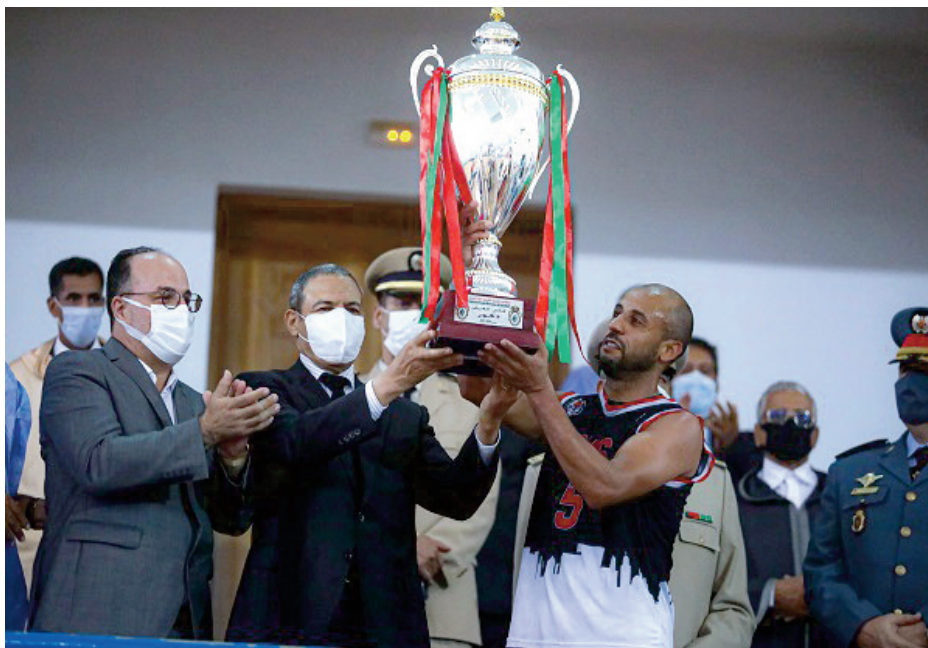
Finale de la Coupe du Trône de basketball