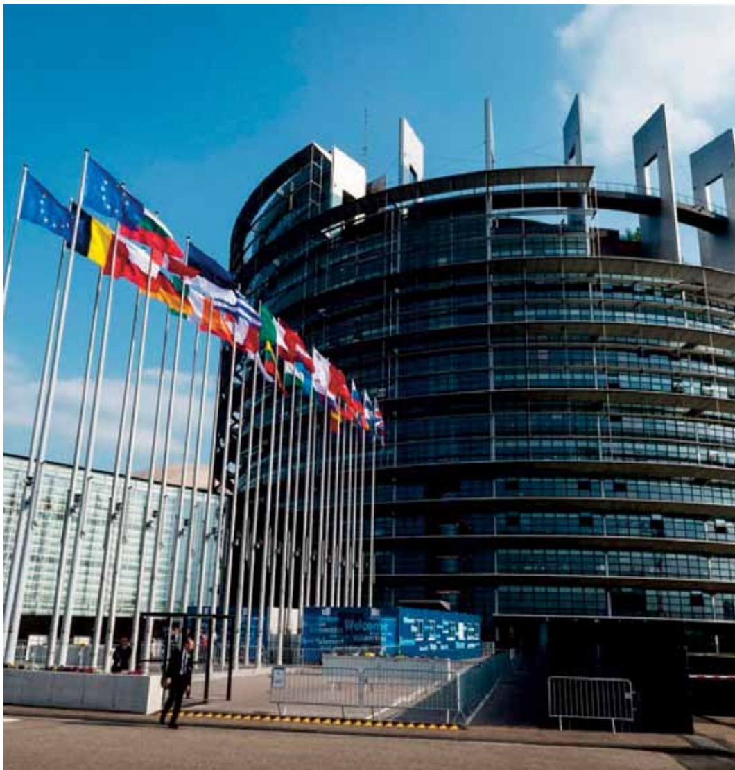
Pages 2,3 et 4

Comment ose-t-on escamoter le passif particulièrement lourd de l'Espagne concernant la protection des mineurs ?