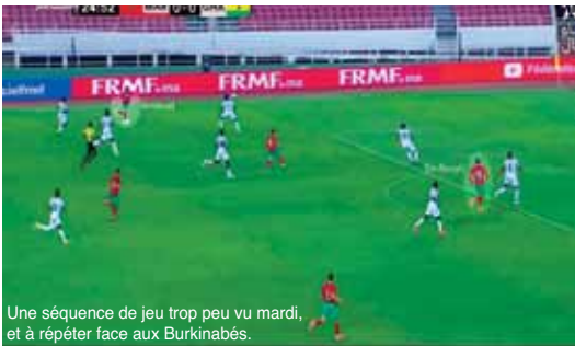
Une séquence de jeu trop peu vu mardi, et à répéter face aux Burkinabés.

réussies par le Onze national, uniquement un tiers a été joué vers l'avant (144). Ce qui traduit une circulation du ballon lente, sans prise de risque et stérile. Les difficultés éprouvées par le Onze national pour transpercer le bloc défensif ghanéen ne sont pas surprenantes. En termes d'expected goals, l'EN n'a pas volé bien haut (1.22 xG). Autrement dit, les Nationaux ne se sont que très rarement créés des situations dangereuses pour marquer. Ou du moins, ils ne pouvaient prétendre à scorer plus d'un but. La faute à une paire de milieu de terrain en mal d'inspiration, et notamment Taarabt qui n'a joué vers l'avant qu'une dizaine de fois en 77 minutes de jeu. Trop peu pour un milieu relayeur censé être le dynamiseur de l'entre-jeu.