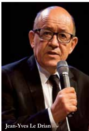
Jean-Yves Le Drian

L'agence espagnole Europa Press a affirmé que le ministre français des Affaires étrangères, Jean-Yves Le Drian, s'est entretenu mercredi avec son homologue espagnole, Arancha González Laya, et avec le chef de la diplomatie marocaine, Nasser Bourita.