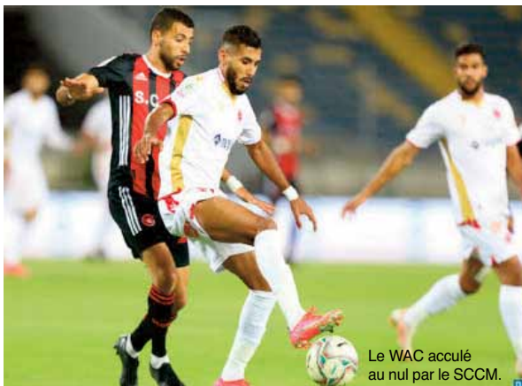
Le WAC acculé au nul par le SCCM.