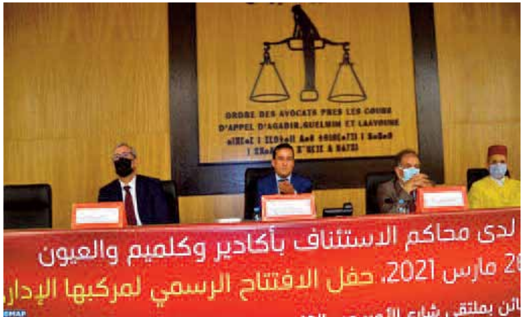
Souss-Massa, Guelmim-Oued Noun, Laâyoune Sakia Al Hamra, et Dakhla Oued-Eddahab.

En marge de cette cérémonie, une convention de partenariat a été signée entre l'Ordre des avocats et les commissions régionales des droits de l'Homme au niveau de