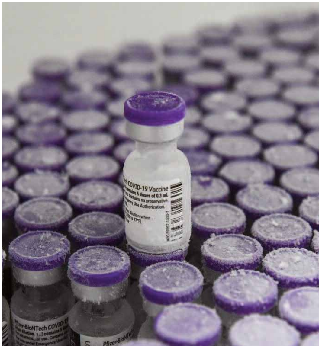
Lire page 3

De nouveaux arrivages des premières doses ardemment attendus