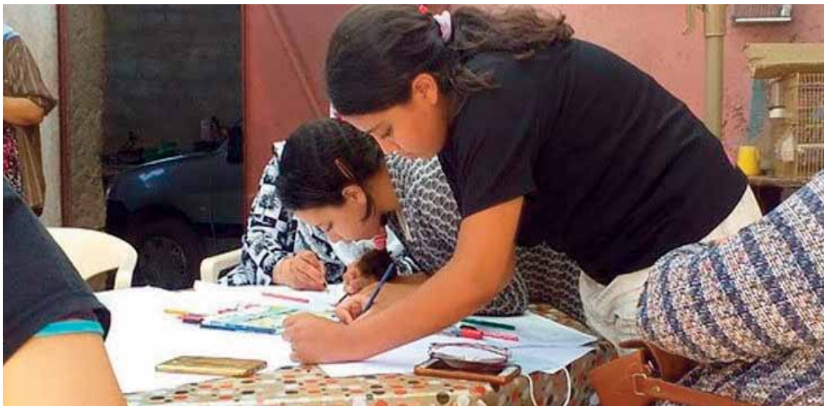
Des jeunes du Nord du Maroc participent à une réunion communautaire (2020 par la Fondation du Haut Atlas).

Les chercheurs en sciences sociales de toutes les disciplines ont partagé une observation qui fera date. Ils ont constaté que les personnes qui appliquent des méthodes dans des contextes réels pour comprendre la vie sociale obtiennent plus d'éclaircissements sur le processus d'enquête que celles qui analysent sérieusement la même chose, mais sans application pratique sur le terrain.