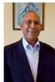
Par Mustapha Jmahri

De toutes les périodes de ma vie au Maroc ou à l'étranger, j'avoue que la cité de Mazagan est restée pour moi synonyme de toutes les joies. Le Maroc mon pays ne s'oublie jamais.