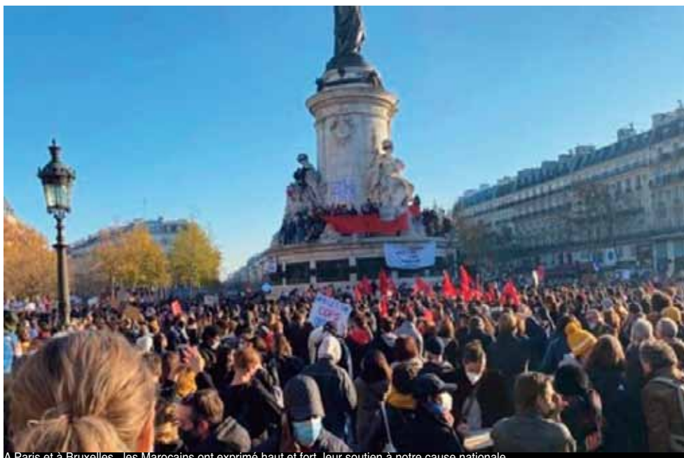
À Paris et à Bruxelles, les Marocains ont exprimé haut et fort leur soutien à notre cause nationale.

"Ces miliciens du Polisario ont tapé sur tout le monde comme en attestent les vidéos qui circulent sur les réseaux sociaux : des