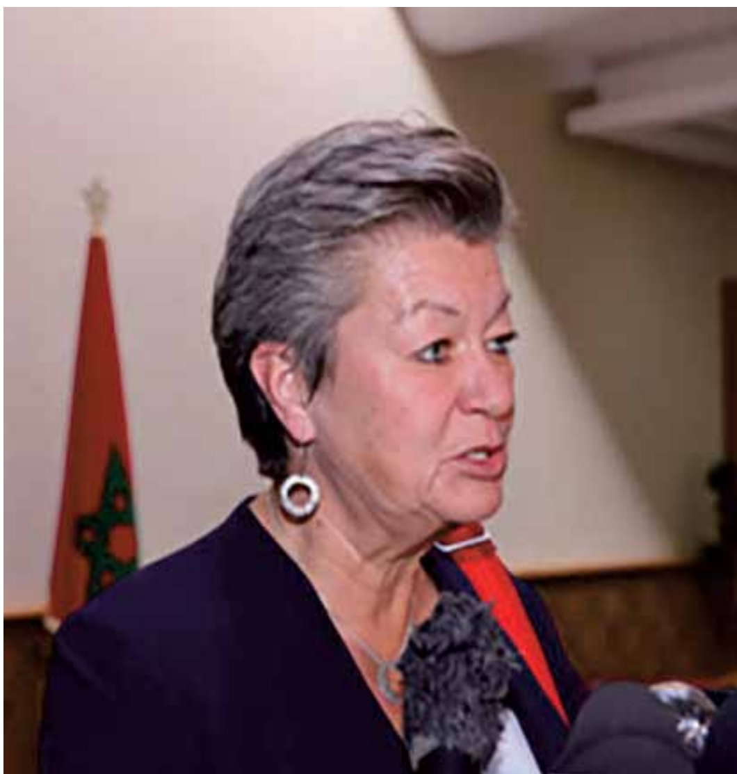
Lire pages 4-5

Ylva Johansson, réussira-t-elle là où d'autres ont échoué ?