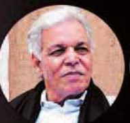
البشير الدخيل رئيس منتدى البدائل الدولي