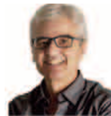
Par Mekki Zouaoui

La sortie de crise exige une injection de monnaie sous forme d'aides massives de l'Etat aux ménages et aux entreprises, moyen incontournable pour faire redémarrer l'économie. Les montants sans précédent des emprunts nécessaires à cela, devraient logiquement inciter l'Etat à recourir exceptionnellement à la monétisation d'une partie appréciable de ses emprunts additionnels dont il est fait le pari qu'ils seront remboursés par le surcroît de croissance économique qu'ils vont générer. Cette sortie de crise est l'occasion aussi pour le Maroc d'atteindre plus rapidement son objectif d'une plus grande flexibilité du dirham.