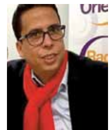
Par Mounir Satouri

S’il faut, selon les propos du président, “reconquérir ce que la République a laissé faire” et faire obstruction au repli identitaire, il serait surtout nécessaire de faire renaître ce que la République a laissé mourir dans ces quartiers. Mais cela demande sans doute bien plus de courage.