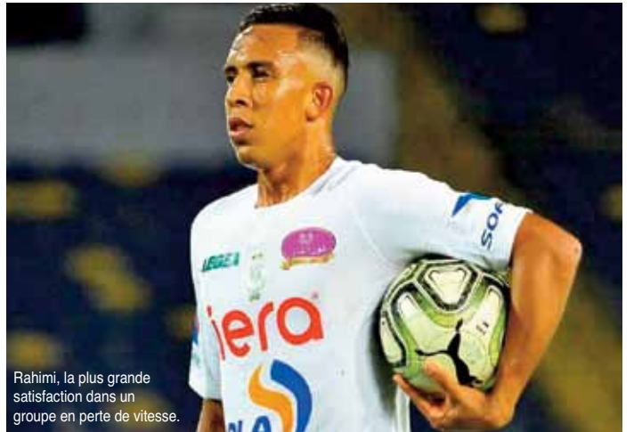
Rahimi, la plus grande satisfaction dans un groupe en perte de vitesse.

RBM-ASFAR : 0-3 MAT-MCO : 4-0 HUSA-WAC : 1-1 RCA-RSB : 2-2