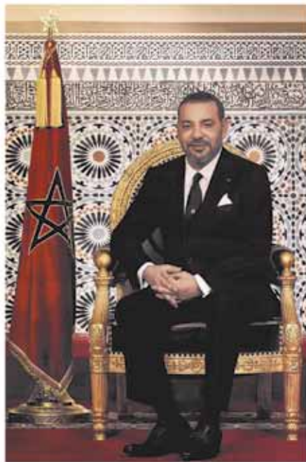
A l'occasion du 21 ème anniversaire de l'accession au trône de SA MAJESTE LE ROI MOHAMMED VI

La machine est en marche pour permettre à l'Oriental de se hisser, conformément aux Hautes orientations Royales visant un développement intégré de cette région, à une place de choix parmi les régions du Maroc.