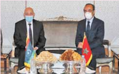
Saleh reçu par El Malki.